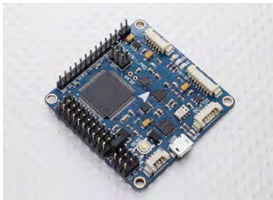
Abbildung : Multiwii and Megapirate AIO Flight Controller w/FTDI (ATmega 2560) V2.0

http://www.multiwii.com/wiki/index.php?title=Multiwii_Beginners_Guide_to_Basic_First_Flight